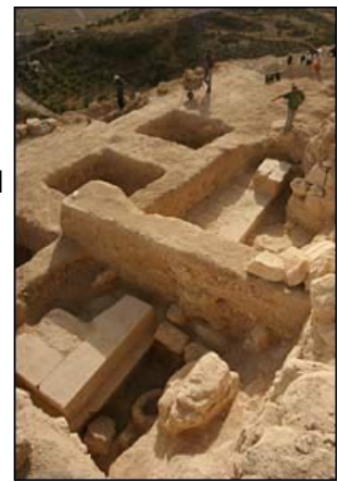
Arheologii cred că acesta este mormântul lui Irod

Irod a fost numit “regele evreilor” de către romani și a condus Iudeea din anul 37 î.Hr. până la moartea sa, în jurul anului 4 d.Hr.