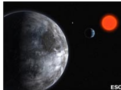
Gliese 581 este prea departe pentru ca telescoapele de pe Pământ să o poată fotografia.

Adică nu oferă niciun fel de speranță celor care ar dori să găsească viață în spațiul extraterestru.