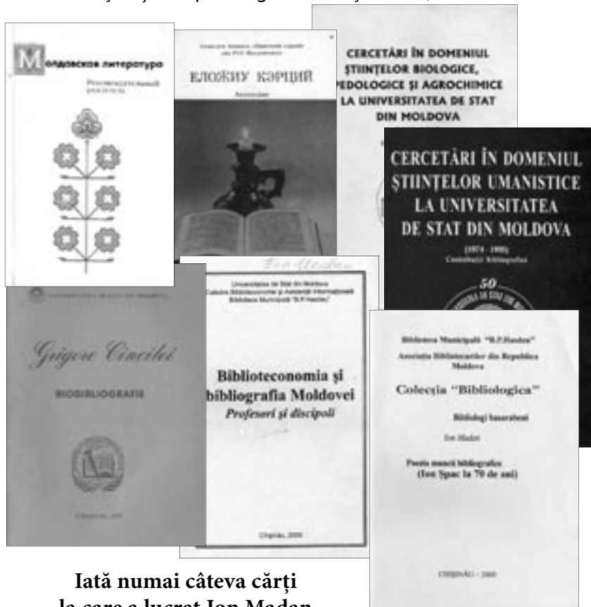
Iată numai câteva cărți la care a lucrat Ion Madan

Redactor-șef: Alexe RĂU Secretar de redacție: Valentina GĂLUȘCĂ e-mail: gazetabib@yahoo.com