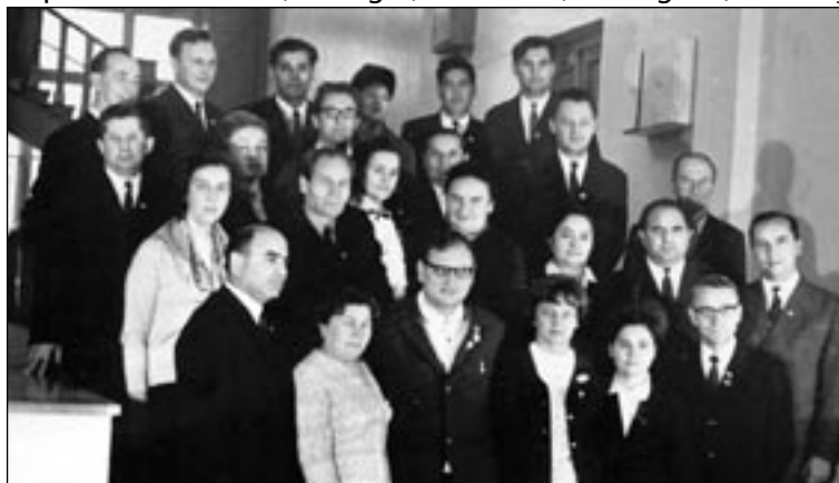
BNRM, anul 1964, participanții la Conferința științifică republicană

Dacă e să discutăm despre portretul în grup al intelectualității bibliologice din Republica Moldova, desigur, anilor a desfășurat o activitate științifică materializată într-un număr apreciabil de cursuri, manuale, bibliografii, lucrări și