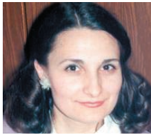
Relatează Angela DRĂGĂNEL